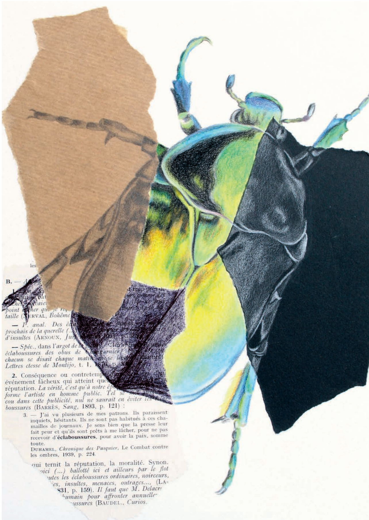
Zur gleichen Zeit, als sich die 3. Klassen im Biologie-Unterricht dem Thema Biodiversität widmeten, haben sie im BG-Unterricht bei Caroline Seiler die hier gezeigten Käfer-Bilder gestaltet.